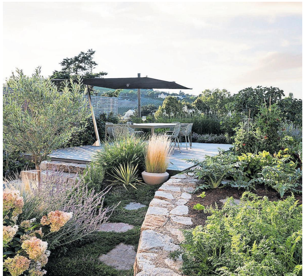
Ausgezeichnet: Gartenidyll mit Kraut, Kräutern und Tomaten von Begründer.

Nutzgarten. Bislang haftete Nutzpflanzen Öko-Müslischarme an. Doch nun punkten Beete mit Kräutern und Gemüse mit stilvoller Optik und werden in die Planung integriert.