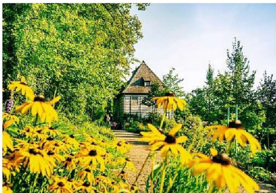
Goethes Gartenhaus in Weimar: für den Dichturfürsten Zeit seines Lebens eine Dase der Inspiration und Erholung