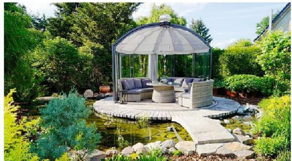
Li.: Dieses moderne Mikrohaus, entworfen von dem deutschen Architekten Karl-Heinz Schommer für Gartana, bietet vielfältige Nutzungsmöglichkeiten. www.gartana.de Re.: Der Pavillon „Rondo“ von Hoklartherm öffnet sich auf Knopfdruck automatisch. hoklartherm.de