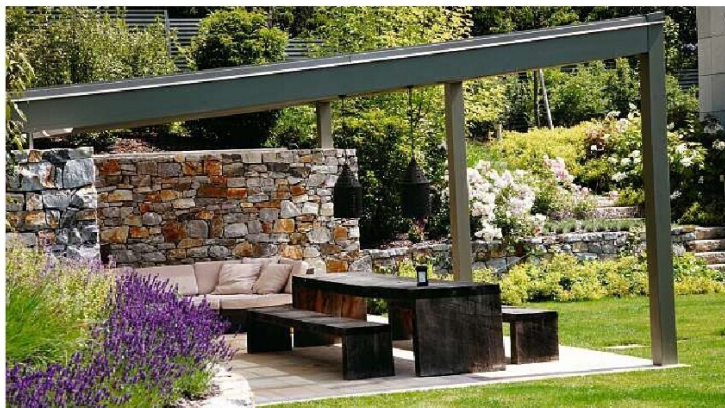
Vorschlag für eine modern-minimalistische Pergola von Lederleitner. lederleitner.at

BASICS. Anschauen, bestellen, hinstellen? Nun, ganz so einfach ist es unter Umständen dann doch nicht. Vor allem, wenn man sich für ein größeres Gartenhaus entscheidet, sollte man vorab einige Überlegungen anstellen. Zunächst: Ist genug Platz vorhanden? Wird ein Fundament benötigt? Möglicherweise muss je nach Größe und Nutzung eine Bewilligung bei der Baubehörde eingeholt werden. Ist all das geklärt, steht Mußestunden mitten „im blühenden Treiben“ nichts mehr im Wege. ■