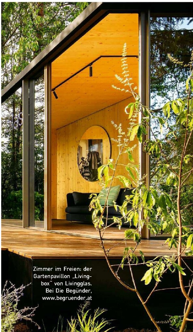
Zimmer im Freien: der Gartenpavillon „Living-box“ von Livingglas. Bei Die Begünder, www.begruender.at