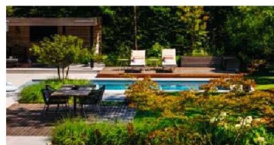
Ihr grünes Reich: Ein Ort der Freude, an dem Sie die Seele baumeln lassen können

Diese Aussage trifft nicht nur auf Ihren Wasserkocher, sondern auch auf Ihren Garten zu. Ob man sich im designten Garten wohl fühlt, hängt von vielen Faktoren ab. Wesentlich und offensichtlich sind Ästhetik, die Erfüllung der eigenen Wünsche in Bezug auf Gartencharakter und Pflegeleichtigkeit. Die Entscheidung wird zu Beginn getroffen: Wird Ihr Garten langfristig zu einer Wohlfühlzone oder fällt er billigen Trends zum Opfer und kommt schnell aus der Mode. Klassisches Design stellt meist den Menschen in den Mittelpunkt. Wenn man im Garten jedoch auf ein harmonisches und ausgeglichenes Miteinander setzen möchte, gilt es, die gesamte Vielfalt an Lebewesen zu berücksichtigen. Im Vordergrund stehen dabei die Pflanzen, die im Idealfall wachsen und gedeihen sollen ohne menschlichen Kraft- und Zeitaufwand. Der perfekt geplante Garten erfüllt genau diese Symbiose.