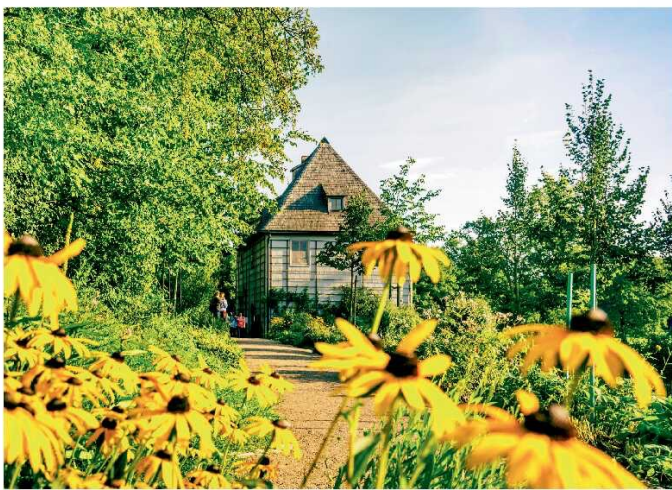
Goethes Gartenhaus in Weimar. Für den Dichter eine Oase der Inspiration und Erholung

» „In der Gartenlaube sitzen, vom blühenden Treiben umspült. Das ist nach meinem Herzen.“ Diese romantische Imagination stammt von Johann Heinrich Voß (1751–1826) und nicht, wie man vielleicht eher vermuten würde, von dessen Dichterkollegen J. W. Goethe (1749–1832). Aber auch dieser war, wie wir wissen, ein passionierter Naturfreund. Wenn ihm das kulturelle Treiben in Weimar zu viel wurde oder er Muße zum Dichten und Denken suchte, zog sich der Herr Geheimrat in sein hiesiges Gartenhäuschen zurück. Das lag idyllisch